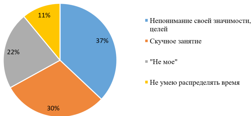
Рис. 1. Основные причины первокурсников прокрастинации научного общества обучающихся

Из диаграммы видно, что большая часть опрошенных не понимают значимости совмещения образовательной деятельности с научной на первом году обучения. Занятия поисковой, научно-исследовательской, изобретательской и рационализаторской работой 30 % вновь прибывших первокурсников считают скучными и не нужными для учебы, поскольку не влияют на отметки в зачетной книжке по конкретным дисциплинам. 22 % опрошенных не заинтересованы в выполнении дополнительной работы, поскольку не видят себя в этой профессии, которые относят себя к «расслабляющим прокрастинаторам», как правило, такой тип склонен к выполнению только тех дел, которые доставляют удовольствие в настоящий момент, или по особо высоким достижениям: сел и через час – изобретение. 11 % не умеют расставлять приоритеты, планировать и распределять целесообразно время. Конечно, можно предположить и тот факт, что процесс адаптации не сформировал нужные копинг-стратегии для достижения успеха, и сработала защитная реакция организма – преобразование лени.