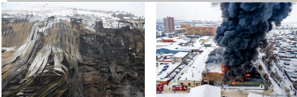
Рис. 2. Фотографии с места пожара на складе автозапчастей в г.Красноярск

В промышленном секторе также наблюдается рост объемов производства. Наиболее интенсивное развитие наблюдается в следующих областях: нефтегазовый сектор, машиностроение, цветная и черная металлургия. Активно развиваются производства пищевой продукции и товаров общего пользования. Для поддержания действующей промышленной системы необходимы не только складские помещения для хранения сырья и готовой продукции, но и производственные мощности, что объясняет рост количества и площадей помещений и зданий производственного назначения.